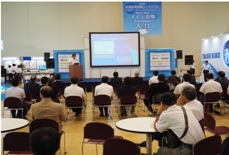
管内カメラ調査に深い関心を示し、説明に聞き入るシンポジウム参加者。