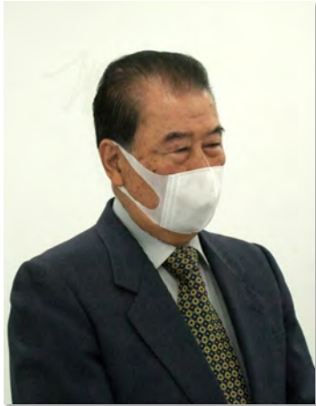
挨拶する杉戸会長