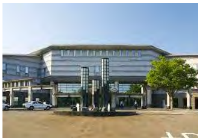
来年の全国水道会議・水道展会場となる仙台国際センター

仙台水道展への出展及び水道研究発表会での発表については、イベントそのものが中止となったため、残念ながら出展・発表ともに取り止めになりました。